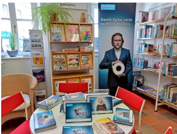
Ausstellung „weißer Ring“