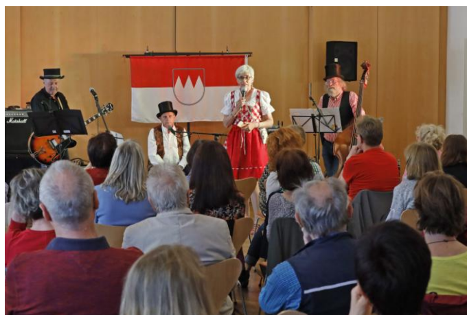
25 Jahre MILKAN Jubiläumsabend