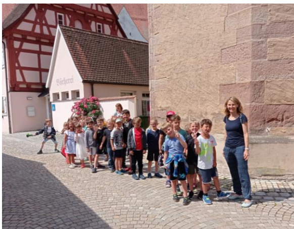
Schulklassenbesuch in der Bücherei