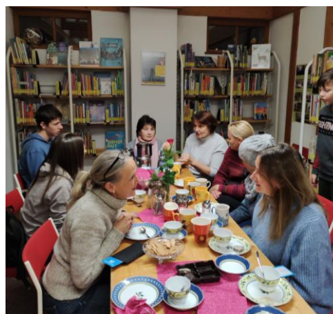
Büchereiführung für Flüchtlinge