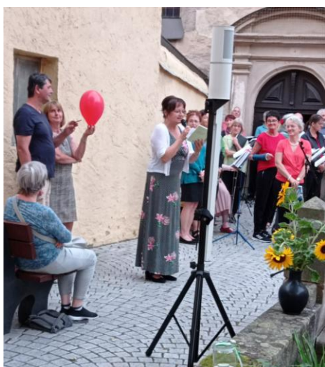
Lieder und Gedichte im Büchereigarten